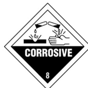
ONU UN 3264