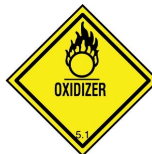
ONU UN: 2014