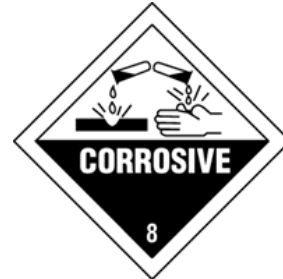
ONU UN 3264